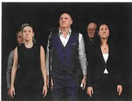
Foto: Anna Rettl: Der beste Arzt, nach Alfred Kubin, 2023 © David Stjernholm

„Raumschatten“ nennt sich die Ausstellung von Hans Kupelwieser in der Stadtgalerie in Klagenfurt (20. Feber bis 10. Mai) . Materialexperimente und architektonisch-räumliche Überlegungen, aber auch eine große Sinnlichkeit – in den letzten Jahren demonstriert an der opulenten Farbigkeit seiner Aluminiumreliefs – verbinden sich zu einem großen Ganzen, durch das man staunend schreitet. „Herzkrug“ von Anna Rettl im Living Studio zeigt vom 24. Feber bis 12. April Variationen von Werken Alter Meister, deren Kompositionen sie mit eigenem Stil, Technik und Inhalt anreichert. „Gestaltete Zeit“ von Christine De Pauli sucht vom 3. März bis 19. April in der Alpen-Adria-Galerie nach der Vielfalt des Lebens. „Wagner Reloaded“ ist eine Ausstellung in Kooperation mit dem Stadttheater in der Theatergalerie (ab 18. März ). www.stadtgalerie.net