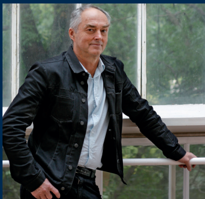
Portraitfoto: Nikolaus Korab © Hans Kupelwieser, Bildrecht Wien, 2026

Sonderführungen: 11.00 Uhr (mit der Kuratorin), 14.00 und 16.00 Uhr