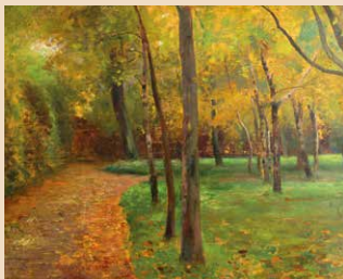
Unten: Waldlandschaft; Fälschung nach Tina Blau Baden, Rollettmuseum

Der Besucher erhält anhand von zahlreichen Exponaten einen spannenden, aber auch unterhaltsamen Abriss über das Fälscherwesen in Kunst, Kultur, Wissenschaft und Wirtschaft. Dieser Streifzug durch die Kunst des Schwindeln zwischen Strategie, Irrtum und Betrug wird durch ein vielfältiges Begleitprogramm ergänzt.