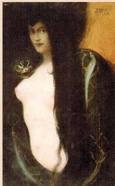
Links: Die Sünde; Fälschung nach dem gleichnamigen Originalgemälde von Franz von Stuck Neue Galerie Graz am Universalmuseum Joanneum

Ohne Original gibt es auch keine Fälschung – und das Geschäft mit beiden ist lukrativ. Ob es sich nun um Spitzenwerke alter Meister oder der klassischen Moderne handelt: Sie erzielen bei Auktionen Rekordpreise. Damit wittern auch Fälscher ihre Chance, hier mitzumischen. Sie führen nicht nur Auktionshäuser, Kunsthändler und Sammler hinters Licht, sondern auch Museen. Heute schätzen Kunstexperten sogar, dass die Umsätze mit verfälschten Werken etwa bei 40 bis 60 Prozent des gesamten Kunstmarktvolumens liegen.