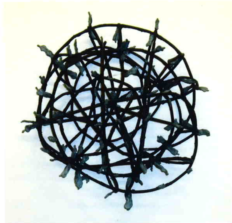
Gunter Damisch „Weltverschlingung III“, 2009, 50 x 54 x 33 cm, Bronzeunikat