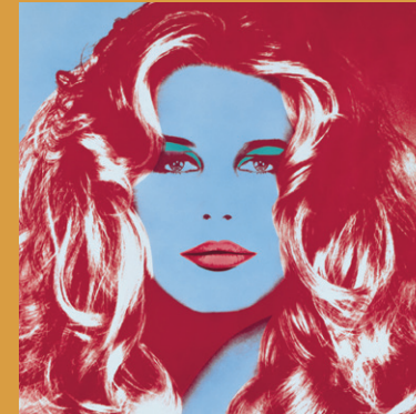
Abb.: Foto © Jay Ullal, 2020 | Andy Warhol, Brigitte Bardot 01, 1974 © 2020 Andy Warhol Foundation for the Visual Arts, Inc. / Artists Right Society (ARS), New York | Andy Warhol, Gunter Sachs 07, 1972 © 2020 Andy Warhol Foundation for the Visual Arts, Inc. / Artists Right Society (ARS), New York | Gunter Sachs, Hommage à Warhol (Claudia Schiffer), 1991 © Estate Gunter Sachs

stadtgalerie@klagenfurt.at, www.stadtgalerie.net